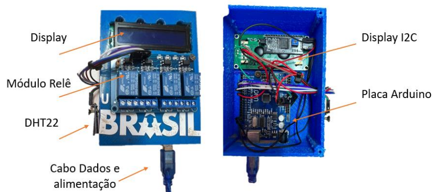
Figura 5 - Protótipo desenvolvido

A primeira vez que o programa for executado pela placa Arduino, todos os comandos serão executados na sequência, ao término, os comandos que estão dentro da função void loop (), serão executados continuamente, até que o equipamento seja desligado. O protótipo desenvolvido é apresentado nas Figuras 5 e 6.