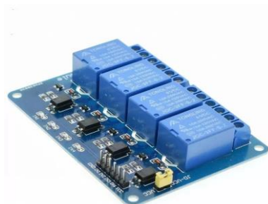
Figura 4 - Módulo relé 4 canais

A placa Arduino UNO foi, então, ligada ao módulo relé 4 portas (Figura 4). As portas DC + e DC- foram ligadas nas portas 5V e GND e as portas IN1, IN2, IN3, IN4 foram ligadas às portas digitais do arduino 3, 4, 5 e 6.