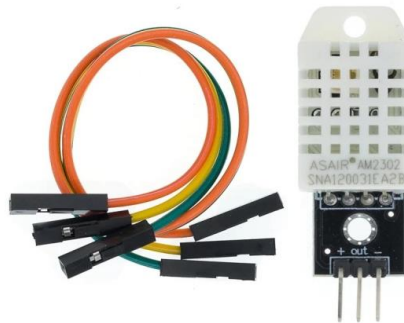
Figura 2 - Módulo sensor DHT22

O display foi ligado pelas portas GND, 5V, SDA e SCL à placa arduíno, nas respectivas portas. Trata-se de display I2C, o qual utiliza o protocolo de comunicação I2C, no qual é instalada uma placa microcontrolada que converte as mensagens enviadas ao display (Figura 3).